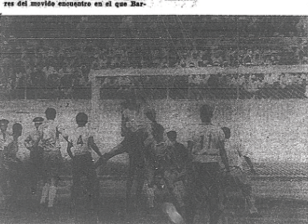
En los últimos minutos se jugó sobre el arco barcelonés. Los eléctricos pugnaban por el gol del triunfo, pero la cerrada defensa de los canarios anuló las intenciones de la ofensiva rival. Patterson y Lecaro se elevan para despejar de testa, impidiendo que actúe Raffo. Nótese la afilencia de jugadores en el arco de Helinho. Hasta Tiriza (11) ha bajado en ayuda de sus compañeros.