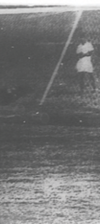
pedir el primer gol de Barcelona. Se inicia la ruta triunfal del nuevo Campeón Nacional.