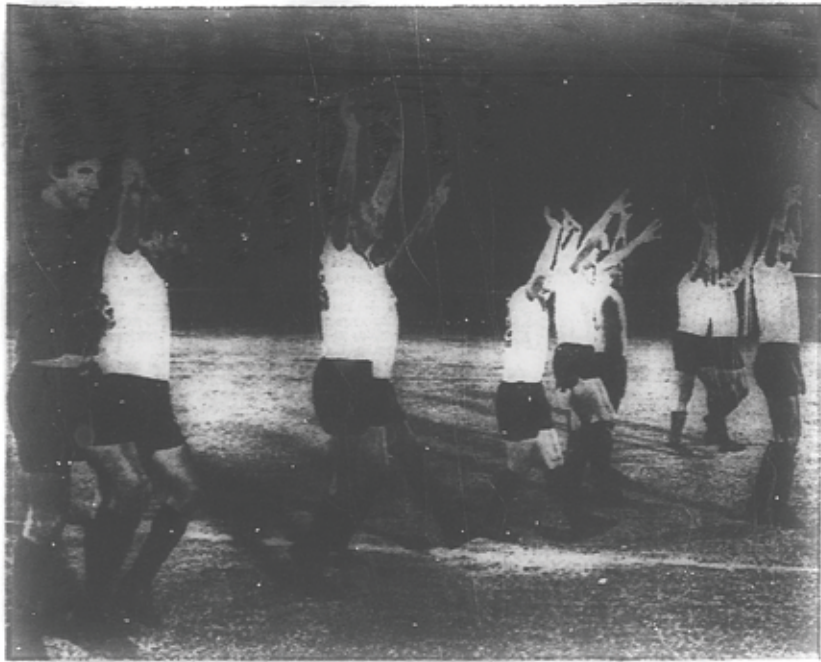
BARCELONA: IDOLO Y CAMPION DEL ECUADOR.— Los brazos en alto del equipo barcelonés presagian la conquista del título nacional. Derrotaron al

Ganó al Quito 2-0 y Reconquistó Título Para Guayaquil