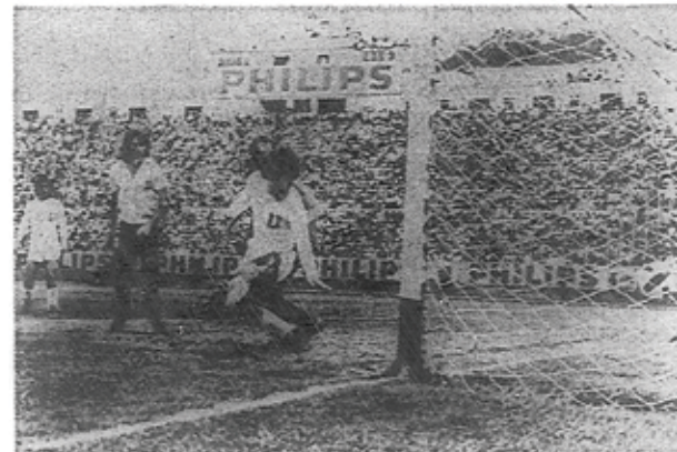
Aucas empató el partido y sus hinchas estremecen el estadio "Atahualpa" con sus gritos de alegría.

QUITO, 25.— (Alfredo Rodríguez Coli).— Liga Deportiva Universitaria, empatando con Aucas tres a tres, se coronó bi — campeón del fútbol ecuatoriano, acumulando trece puntos y logrando una ventaja insuperable por parte del equipo de participantes en la Liga, esto es, Barcelona, Deportivo Cuenca, Aucas y Universidad Católica.