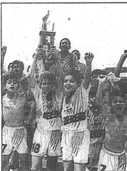
Bastión S.C. y Barcelona, son los nuevos monarcas del fútbol barrial, al adjudicarse los torneos Princesas del Fútbol y Buscando Nuevos Cracks.